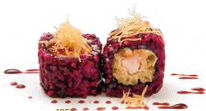
195 BLACK EBITEN* maionese, gambero fritto, kataifi e teriyaki 8pz € 12,00