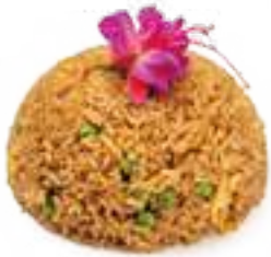
330 RISO SALTATO SPECIALE* gamberi, uova, pollo, piselli, zenzero € 7,00