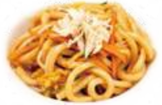
323 UDON CON POLLO* verdure miste e pollo € 8,00