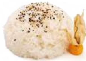
331 GOHAN riso bianco con sesamo € 3,00