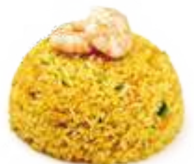
332 RISO CON GAMBERI* uova, verdure, gamberi € 8,00