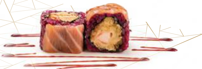
193 BLACK TIGER* gamberi fritti, maionese, salmone e salsa teriyaki 8pz € 12,00