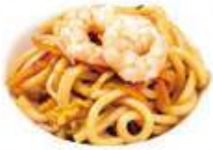
320 UDON CON GAMBERI* gamberi e verdure € 9,00