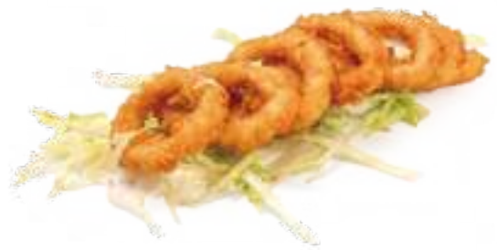
374 IKA FRY* calamari fritti € 10,00