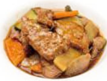
353 MANZO VERDURE* € 7,00