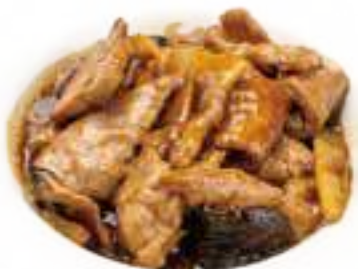
352 MANZO CON BAMBU* E FUNGHI € 7,00