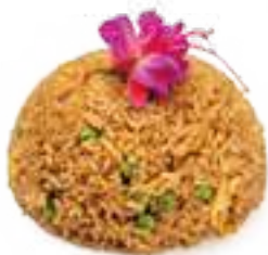
330 RISO SALTATO SPECIALE* gamberi, uova, pollo, piselli, zenzero € 7,00