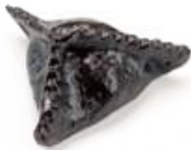
23 RAVIOLI MERLUZZO* merluzzo 3pz € 5,00