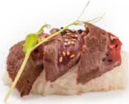
220 CHIRASHI SPECIAL*