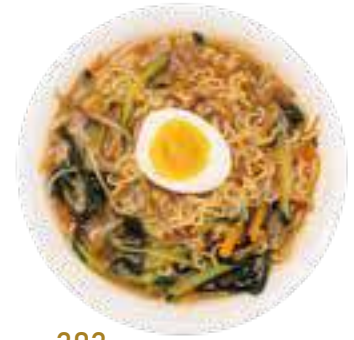
303 RAMEN IN BRODO CON VERDURE E UOVA verdure miste e uova € 8,00