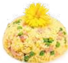
334 RISO CANTONESE* piselli, uova e prosciutto cotto € 6,00