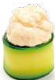
84 GUNKAN EBI* zucchine, gamberi e maionese 2pz € 5,00