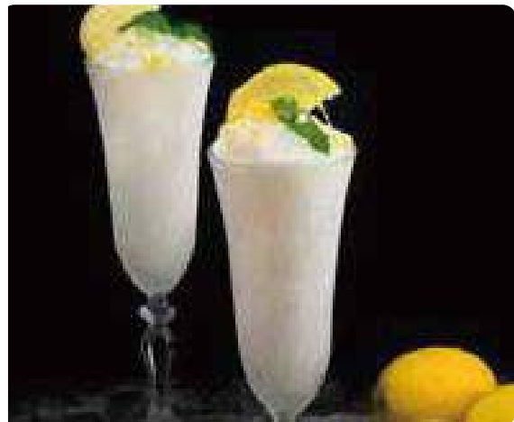
SORBETTO AL LIMONE*