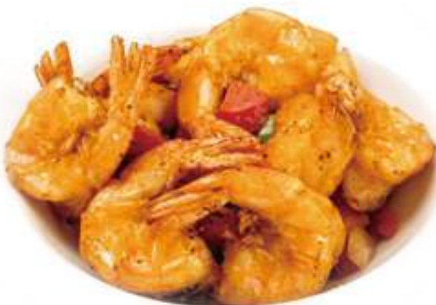
363 GAMBERI SALE E PEPE* € 8,00