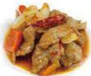
350 MANZO PICCANTE* € 7,00

Tutti i secondi piatti contengono glutine