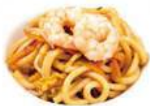
320 UDON CON GAMBERI* gamberi e verdure € 9,00