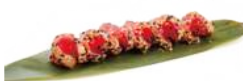
295 TATAKI TONNO* tonno scottato con salsa teriyaki € 13,00