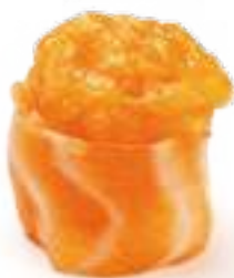
80 GUNKAN SAKE* salmone, salsa tabasco e maionese 2pz € 5,00