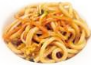
321 UDON CON VERDURE verdure miste € 6,00