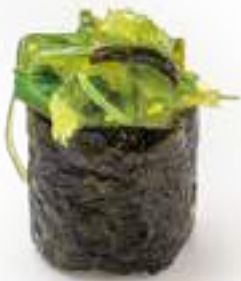
89 GUNKAN WAKAME* goma wakame 2pz € 4,00