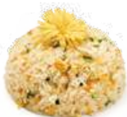
333 RISO CON VERDURE verdure miste e uova € 6,00