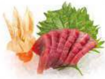
292 SASHIMI TONNO 6PZ* € 10,00