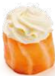
90 GUNKAN FRESH* philadelphia e salmone 2pz € 6,00