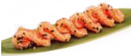
294 TATAKI SALMONE* salmone scottato con salsa teriyaki € 11,00