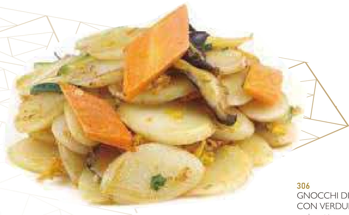
306 GNOCCHI DI RISO CON VERDURE* verdure miste e uova € 8,00