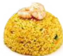
332 RISO CON GAMBERI* uova, verdure, gamberi € 8,00