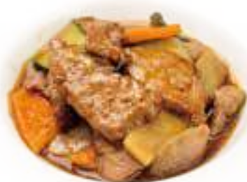
353 MANZO VERDURE* € 7,00