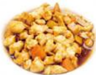
340 POLLO MANDORLE* € 6,00

Tutti i secondi piatti contengono glutine