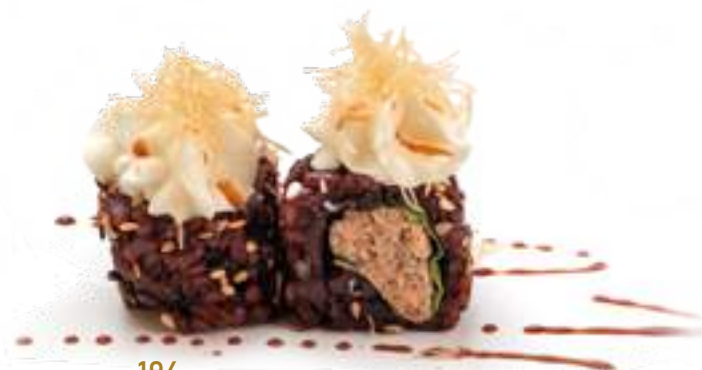
196 BLACK MIURA* salmone cotto, insalata, philadelphia, kataifi e salsa teriyaki 8pz € 10,00