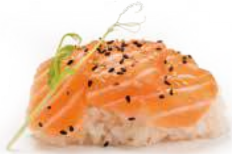
221 CHIRASHI SALMON* € 11,00