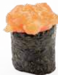
82 GUNKAN SPICY SALMON* salmone piccante, salsa tabasco e maionese 2pz € 4,00