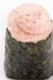
85 GUNKAN SURIMI* polpa di granchio e maionese 2pz € 4,00