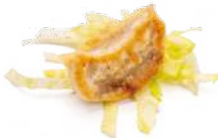
27 GYOZA BRASATI* carne di maiale e verdure 3pz € 6,00