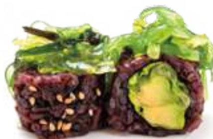
194 BLACK VEGETARIANO wakame, avocado, insalata 8pz € 10,00