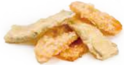
371 TEMPURA YASAI verdure fritte € 8,00