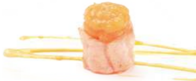
91 GUNKAN PURÈ SAKE* Salmone scottato, purè di patate, spicy salmone, salsa zafferano 2pz € 5,00