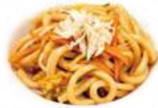
323 UDON CON POLLO* verdure miste e pollo € 8,00