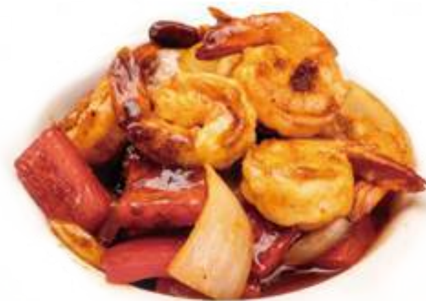
361 GAMBERI PICCANTI* € 8,00