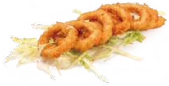
374 IKA FRY* calamari fritti € 10,00