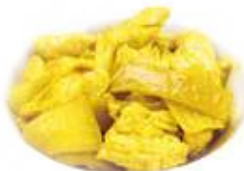
343 POLLO AL CURRY* € 6,00