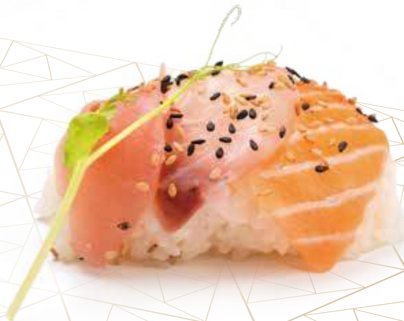
223 CHIRASHI MISTO* € 11,00