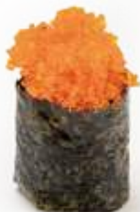
86 GUNKAN TOBIKO* uova di pesce 2pz € 5,00