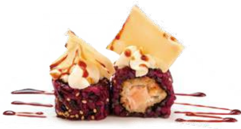
192 BLACK SALMON CRISPY* salmone fritto, philadelphia, chips e teriyaki 8pz € 10,00