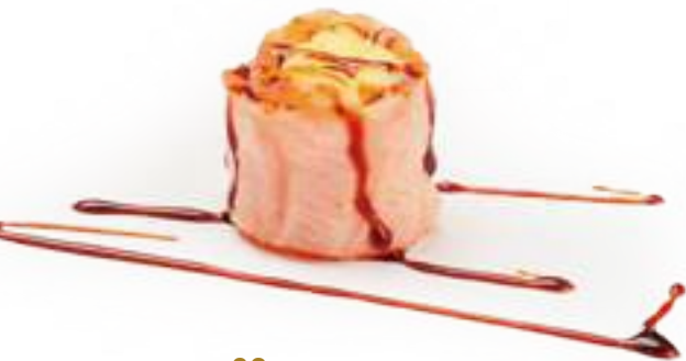
92 GUNKAN PURÈ* salmone, purè di patate e salsa teriyaki 2pz € 5,00