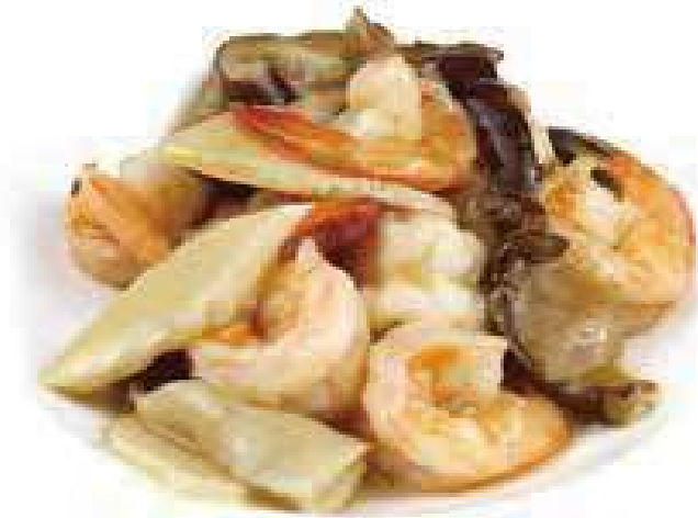
360 GAMBERI FUNGHI E BAMBU'* € 8,00

Tutti i secondi piatti contengono glutine