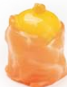
88 GUNKAN QUAGLIA* salmone, uova di quaglia e salsa ponzu 2pz € 5,00