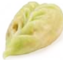
24 RAVIOLI VERDURE* verdure miste 3pz € 5,00