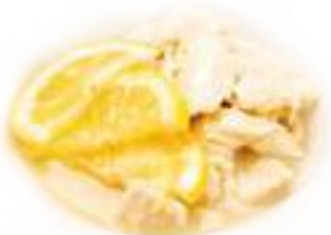
342 POLLO AL LIMONE* € 6,00