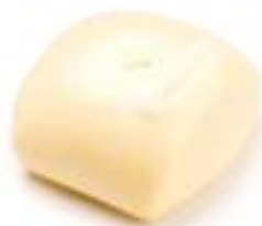
26 PANE AL VAPORE 2PZ* € 3,00