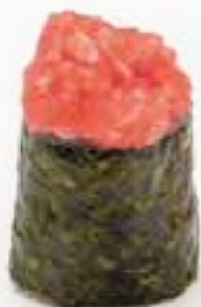
83 GUNKAN SPICY TUNA* tonno piccante, salsa tabasco e maionese 2pz € 4,00