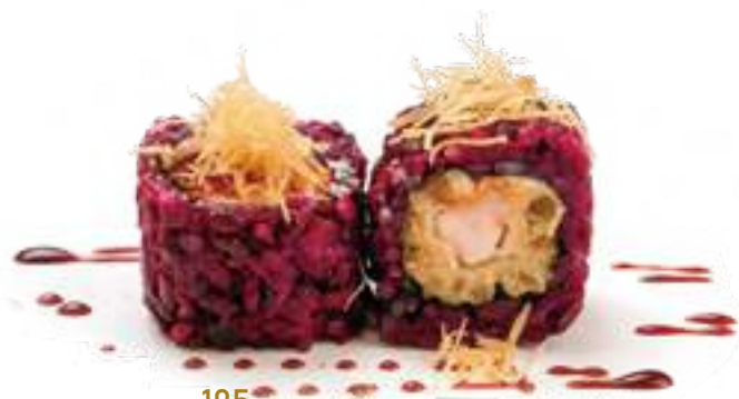
195 BLACK EBITEN* maionese, gambero fritto, kataifi e teriyaki 8pz € 12,00