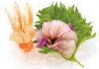
293 SASHIMI BRANZINO 6PZ* € 8,00