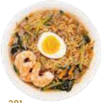
301 RAMEN IN BRODO CON GAMBERI E UOVA* gamberi, verdure miste e uova € 8,00