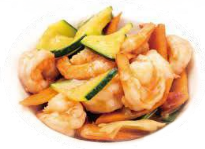
362 GAMBERI CON VERDURE* € 8,00