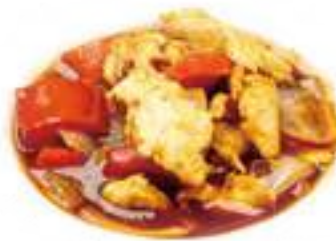
341 POLLO PICCANTE* € 6,00