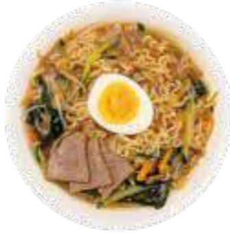
302 RAMEN IN BRODO CON MANZO E UOVA* manzo, verdure miste e uova € 8,00