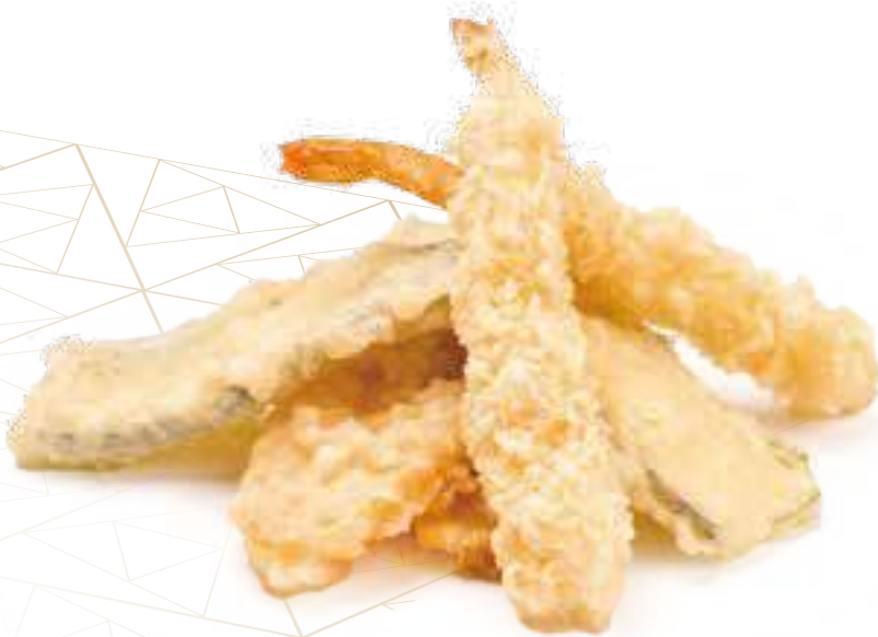
372 TEMPURA MORIAWASE* verdure e gamberi fritti € 10,00