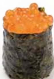
87 GUNKAN IKURA* uova di pesce 2pz € 6,00