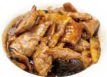
352 MANZO CON BAMBU* E FUNGHI € 7,00