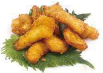
373 TEMPURA POLLO* pollo fritto € 8,00