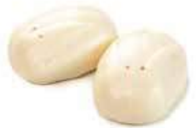
25 PANE RIPIENO CREMA* € 3,00