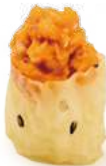
96 GUNKAN MAGURO 2.0* tonno piccante, salsa tabasco e maionese 2pz € 5,00