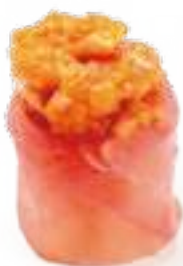
81 GUNKAN MAGURO* tonno, salsa tabasco e maionese 2pz € 5,00