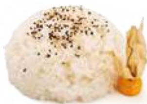
331 GOHAN riso bianco con sesamo € 3,00