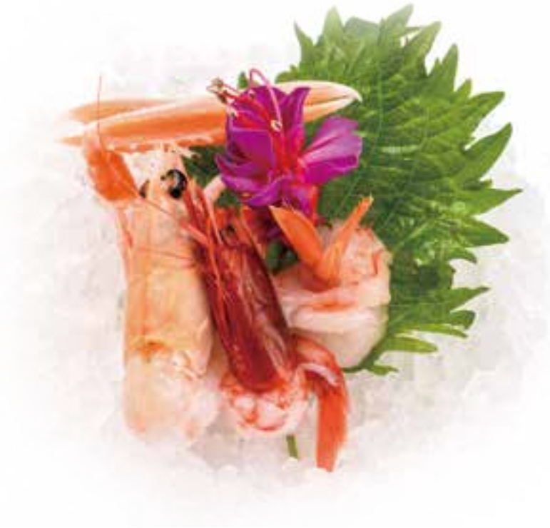
290 SASHIMI GOURMET* 1 scampo, 1 amaebi, 1 gambero rosso € 8,00