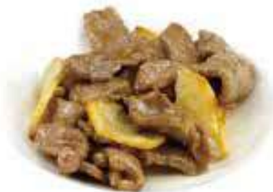
351 MANZO CON PATATE* € 7,00