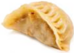
20 GYOZA* carne di maiale e verdure 3pz € 5,00