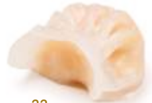
22 RAVIOLI CRISTALLO* gamberi 3pz € 6,00