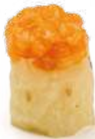
93 GUNKAN SAKE 2.0* salmone piccante, salsa tabasco e maionese 2pz € 4,50