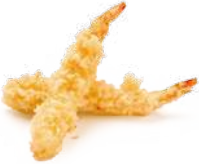
370 TEMPURA EBI* gamberi fritti € 12,00