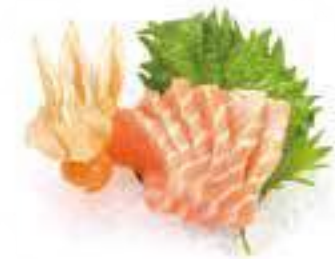
291 SASHIMI SALMONE 6PZ* € 8,00