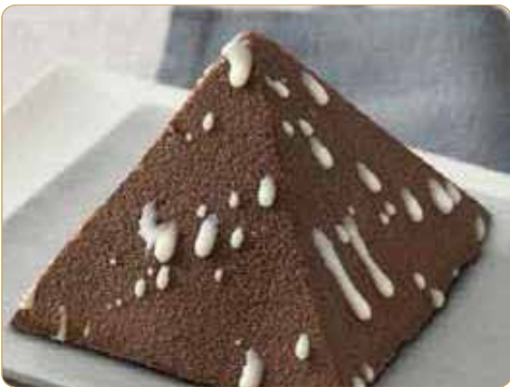
PIRAMIDE AL CIOCCOLATO*

Tutti i dolci non sono compresi nel menù tasting