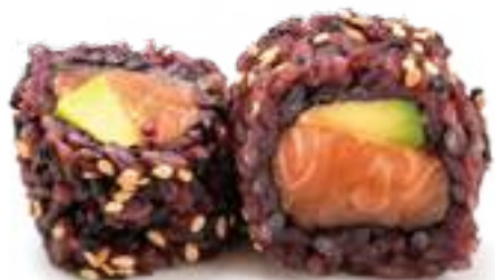
191 BLACK SAKE* salmone e avocado 8pz € 10,00