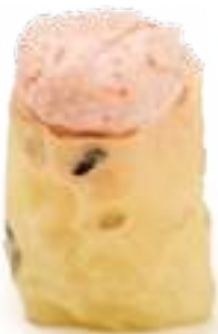
95 GUNKAN SURIMI 2.0* polpa di granchio e maionese 2pz € 4,50