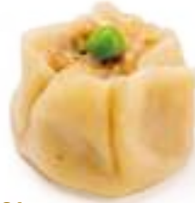
21 SHUMAI* gamberi, castagne d'acqua, carne di maiale 3pz € 5,00