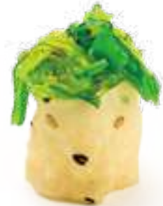
94 GUNKAN WAKAME 2.0* goma wakame 2pz € 4,50