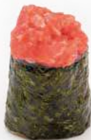
83 GUNKAN SPICY TUNA*

tonno piccante, salsa tabasco e maionese 2pz