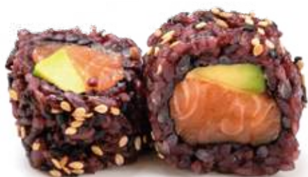
191 BLACK SAKE* salmone e avocado 8pz € 10,00