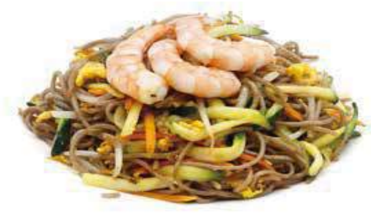
315 SOBA CON GAMBERI* gamberi, verdure miste e uova € 9,00