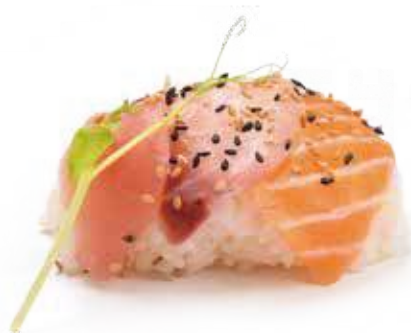
223 CHIRASHI MISTO* € 11,00