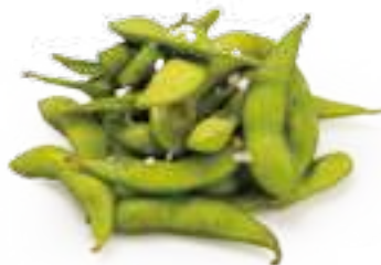
8 EDAMAME* baccelli di soia € 5,00