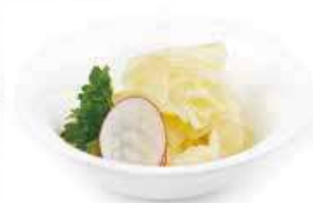
12 GARI ZENZERO* € 3,00