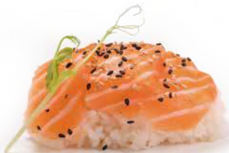
221 CHIRASHI SALMON* € 11,00