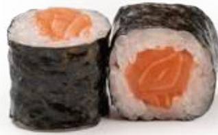
113 HOSOMAKI SALMONE* salmone 8pz € 6,00