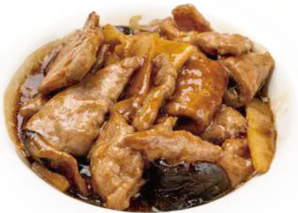
352 MANZO CON BAMBU* E FUNGHI € 7,00