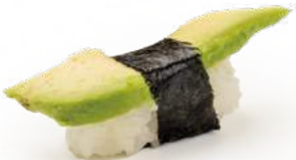
60 AVOCADO avocado 2pz € 3,00