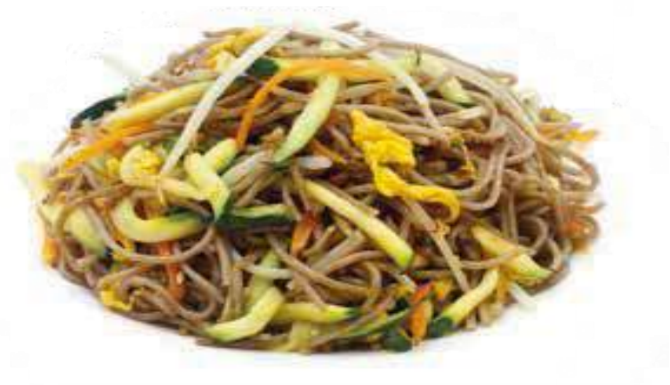
316 SOBA CON VERDURE verdure miste e uova € 6,00