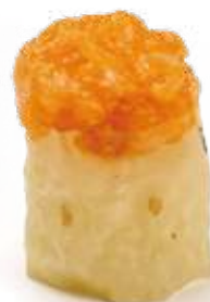
93 GUNKAN SAKE 2.0*

salmone piccante, salsa tabasco e maionese 2pz