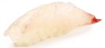
53 BRANZINO* branzino 2pz € 3,00