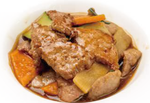
353 MANZO VERDURE* € 7,00