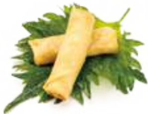
1 INVOLTINO PRIMAVERA* verdure miste 2pz € 3,00