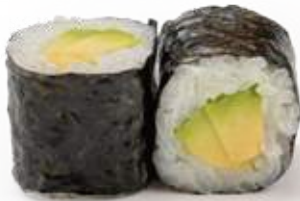
114 HOSOMAKI AVOCADO avocado 8pz € 6,00