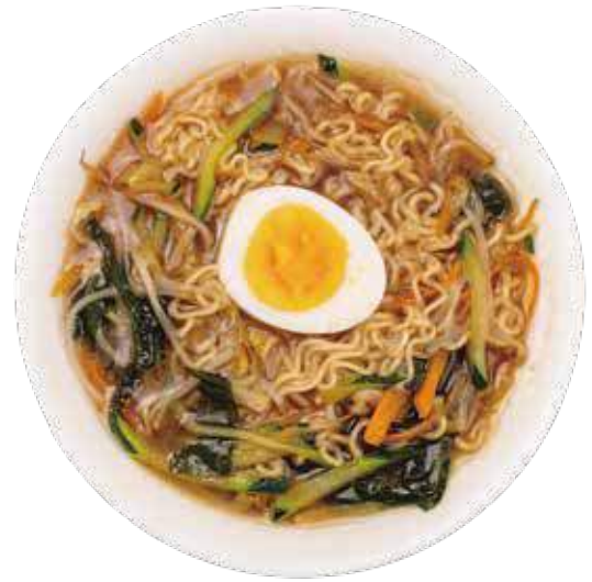
302 RAMEN IN BRODO CON MANZO E UOVA* manzo, verdure miste e uova € 8,00