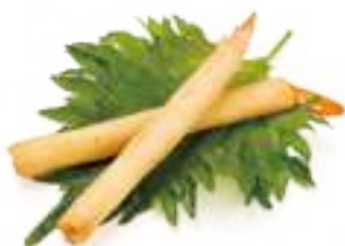
4 GAMBERI STICK* involtino di gamberi 2pz € 5,00