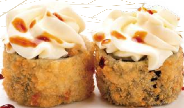
110 HOSOMAKI FRITTO* salmone, philadelphia e salsa teriyaki 8pz € 7,00