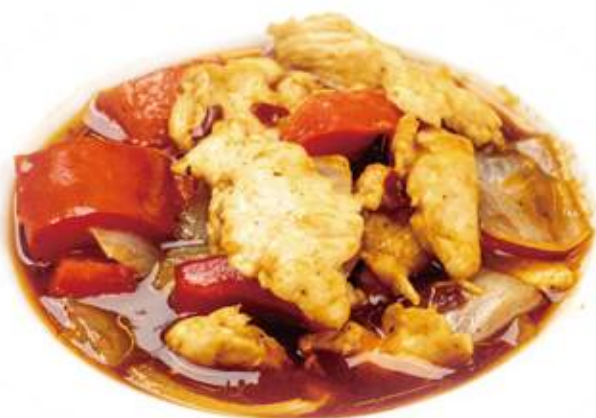
341 POLLO PICCANTE* € 6,00