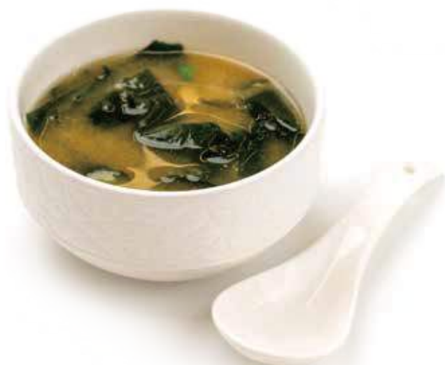
40 MISO SHIRO tofu, alghe, erba cipollina € 3,00