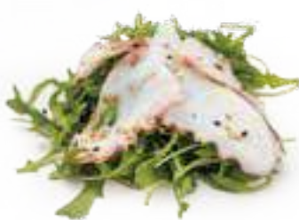
11 POLPO RUCOLA* € 7,00