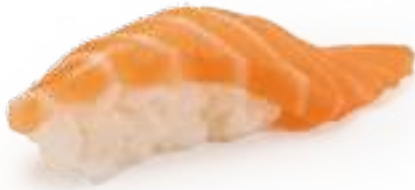
51 SALMONE* salmone 2pz € 3,00