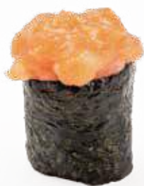
82 GUNKAN SPICY SALMON*

salmone piccante, salsa tabasco e maionese 2pz