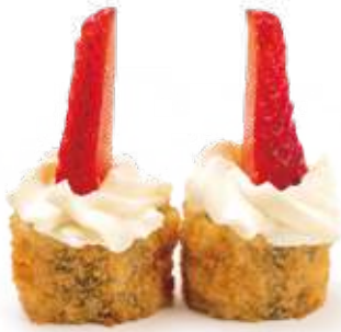
111 HOSOMAKI FRITTO FRAGOLA* salmone, fragola e philadelphia 8pz € 8,00