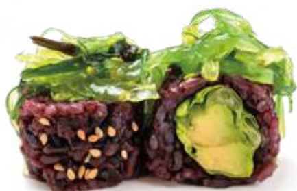
194 BLACK VEGETARIANO wakame, avocado, insalata 8pz € 10,00