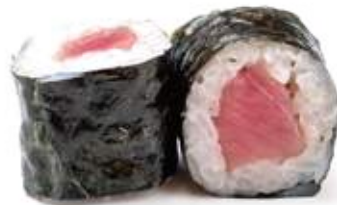
115 HOSOMAKI TONNO* tonno 8pz € 6,00