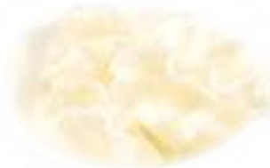
6 NUVOLE DI DRAGO € 4,00