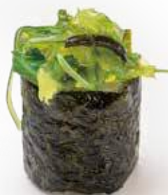
89 GUNKAN WAKAME*