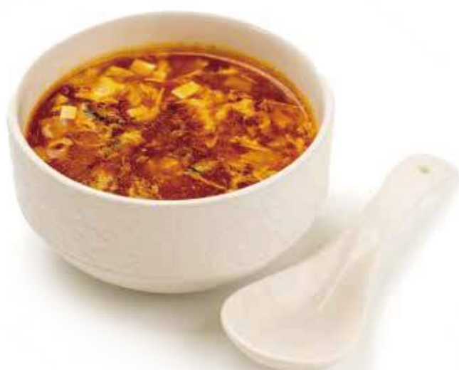
41 ZUPPA AGRO-PICCANTE uova, tofu, verdure, funghi € 4,00