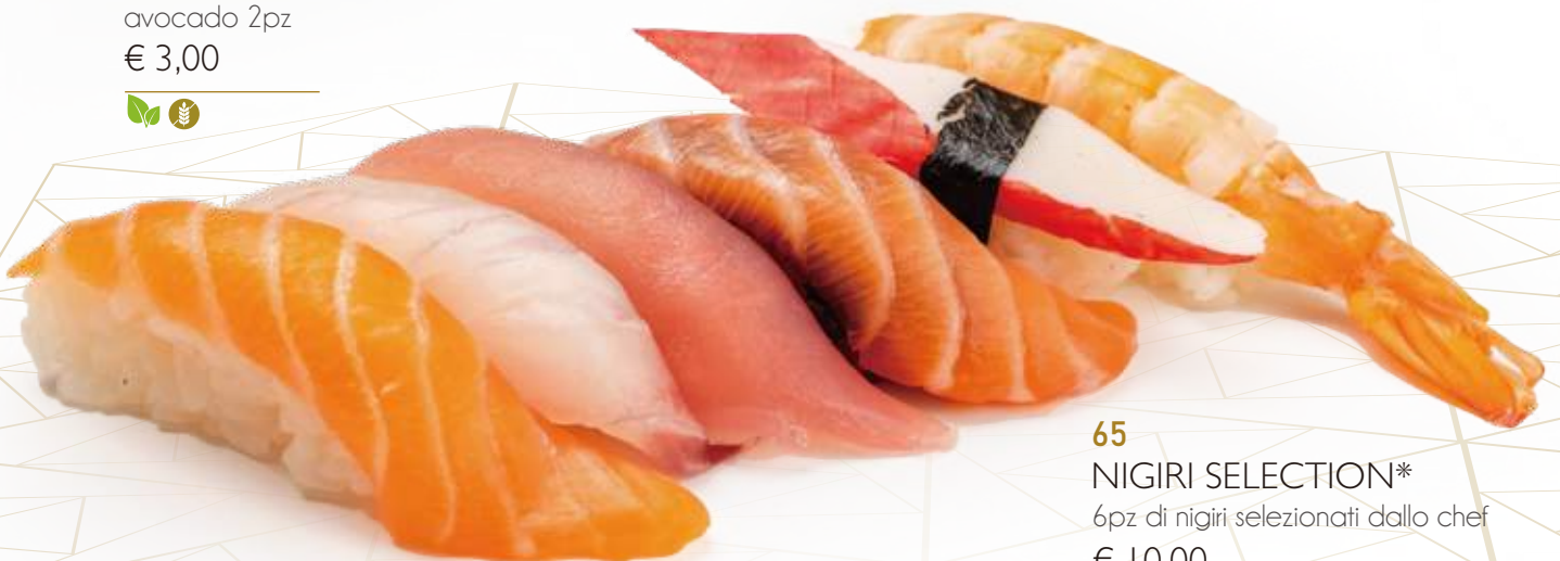
65 NIGIRI SELECTION* 6pz di nigiri selezionati dallo chef € 10,00