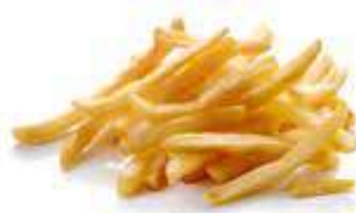
9 PATATINE FRITTE* € 5,00