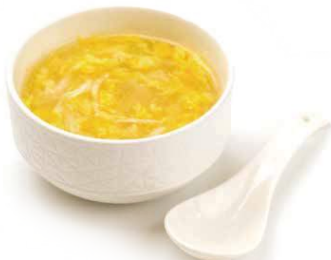
42 ZUPPA POLLO MAIS* uova, pollo, mais € 4,00