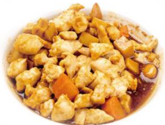
340 POLLO MANDORLE* € 6,00

Tutti i secondi piatti contengono glutine