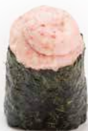
85 GUNKAN SURIMI*