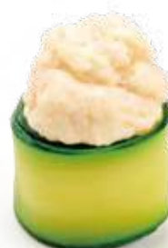
84 GUNKAN EBI*