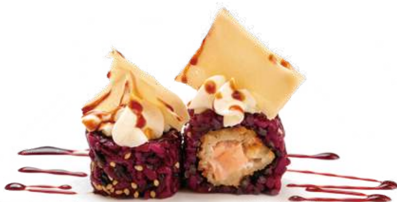
192 BLACK SALMON CRISPY* salmone fritto, philadelphia, chips 8pz € 10,00