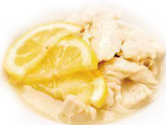
342 POLLO AL LIMONE* € 6,00