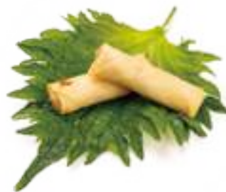
3 HARUMAKI* involtino salmone philadelphia 2pz € 4,00