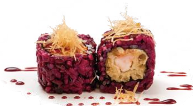
195 BLACK EBITEN* maionese, gambero fritto, kataifi e teriyaki 8pz € 12,00