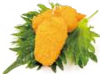
5 CHELE GRANCHIO 2PZ* € 4,00