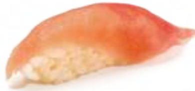
52 TONNO* tonno 2pz € 4,00