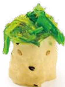
94 GUNKAN WAKAME 2.0*