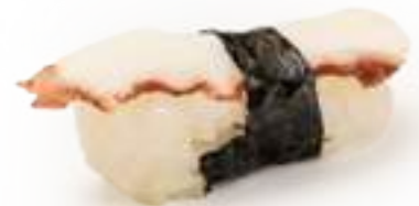
59 POLIPO* polipo 2pz € 3,00