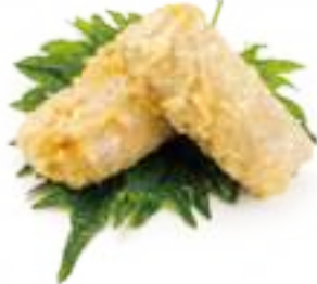
2 INVOLTINO VIETNAMITA* carne e verdure 2pz € 4,00