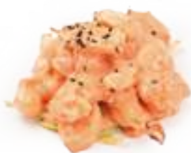
7 COCKTAIL DI GAMBERI* gamberi con salsa rosa € 7,00