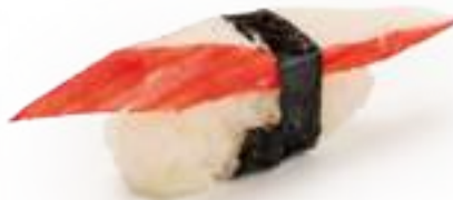
57 SURIMI* polpa di granchio 2pz € 3,00