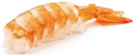
54 GAMBERO COTTO* gambero cotto 2pz € 3,00