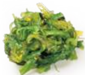
10 GOMA WAKAME* insalata di alghe piccante € 4,00