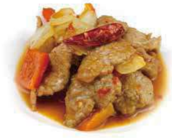
350 MANZO PICCANTE* € 7,00

Tutti i secondi piatti contengono glutine